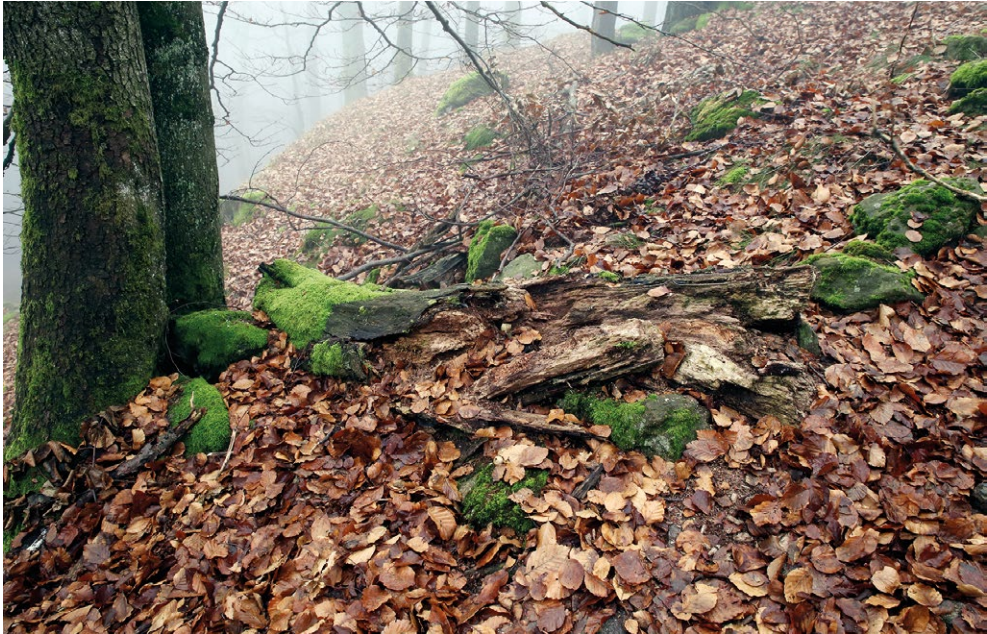
Abb. 6 – Habitat mit liegendem Buchenstamm (Fundort)