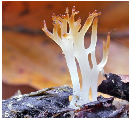
Abb. 1-5 – L. subcaulescens, Standortaufnahmen - und Detailaufnahmen. 1) 28.09.2019, 2) 17.10.2020, 3) 28.09.2019, 4) 01.10.2019, 5) 27.10.2021.