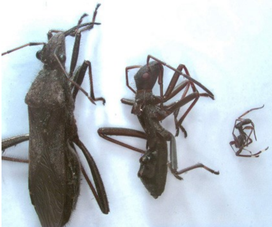
Abb. 2: Imago sowie metamorphoseife und kleine Larve von Alydus calcaratus von der ZSM, August 2004.

Larven wie Imagines wurden insbesondere bei sonnigem Wetter um die Mittagszeit und am frühen Nachmittag aktiv. Häufig kletterten die Larven nach Art der Ameisen an Grashalmen auf- und abwärts oder waren dabei zu finden, wie sie die reifenden Samenbehälter der in kleinen Gruppen vorkommenden Kicher-Tragant-Pflanzen anstachen und daran saugten.