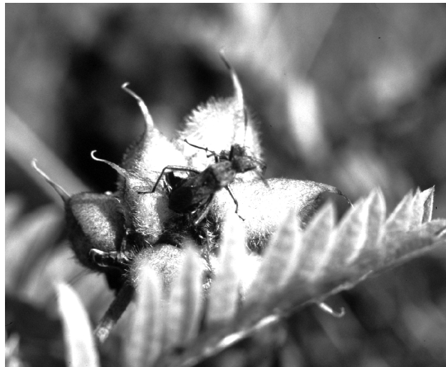
Abb. 1: Eine große Alydus -Larve beim Anbohren einer noch grünen Samenschote des Kicher-Tragants Astagalus cicer . (Foto: REICHHOLF)

Die Rotrückige Irrwischwanze Alydus calcaratus (LINNÉ, 1758) repräsentiert als einzige in Deutschland verbliebene Art die Familie der Krümmfüßlerwanzen (Alydidae) (WACHMANN 1989). Im Imaginalstadium fällt sie durch ihre Beweglichkeit auf (Name!). Sie läuft am Boden, klettert in der Vegetation und fliegt bei geringfügigen Störungen bereits auf. Dabei wird ihre bezeichnende rötlichbraune Oberseite sichtbar. An den Hinterbeinen ist die Schiene (Tibia) gerade und etwa so lang wie der kräftige, bedornete Schenkel (Femur). Darin unterscheidet sich die Art vom im mediterranen Bereich häufigen „Sichelbein“ Camptopus lateralis . Bei der Vielgestaltigkeit der Morphologie von Wanzen wäre dies nicht sonderlich bemerkenswert, wenn nicht die Larven von Alydus calcaratus eine so frappierende Ameisenmimikry zeigen würden, dass man wirklich genau hinsehen muss, um sie am Vorhandensein des Rüssels von in Größe, Gestalt und Farbe sehr ähnlichen Ameisen unterscheiden zu können. Nach WACHMANN l. c. ist nichts Näheres über die Beziehungen der Alydus -Larven zu Ameisen bekannt. Sie sollen, zumindest in den jüngeren Larvenstadien, in Ameisennestern (parasitisch, kommensal?) leben. Zur Biologie der Art gibt es offenbar nur recht allgemeine Angaben. Die Irrwischwanzen leben an der Küste, auf sandigen Böden und Heiden und ernähren sich hauptsächlich phytophag von reifen wie unreifen Samen, deren Säfte sie aufsaugen (Quelle: WIKIPEDIA).