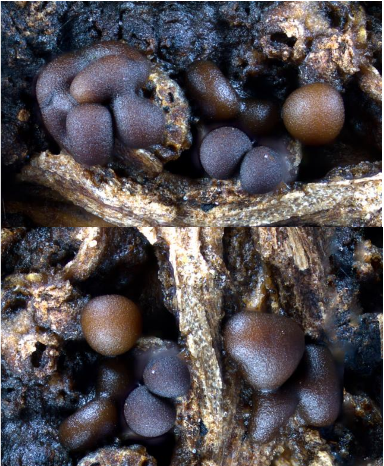
A. Esporocarpos. Hoyer. Objetivo 100x.