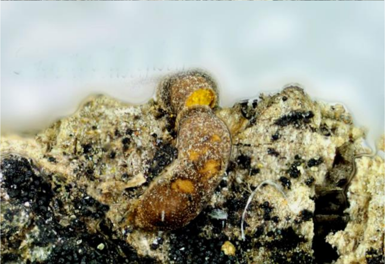
B. Esporocarpos. Hoyer. Objetivo 100x.