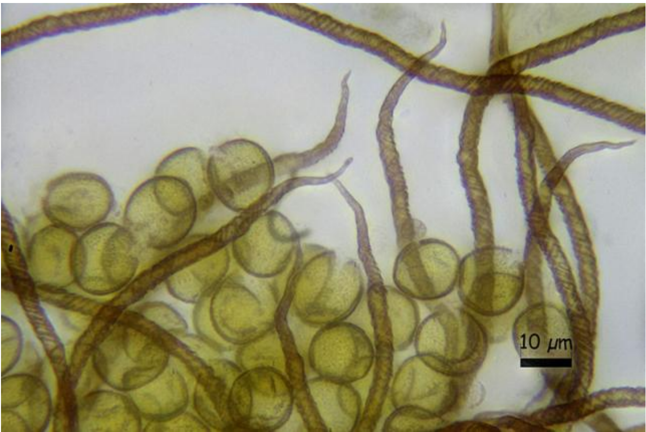
B. Capilicio y esporas agua 1000x.