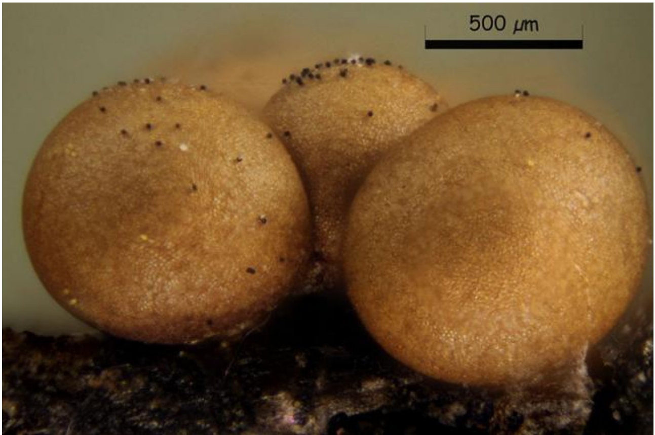
C. Esporocarpos 100x.