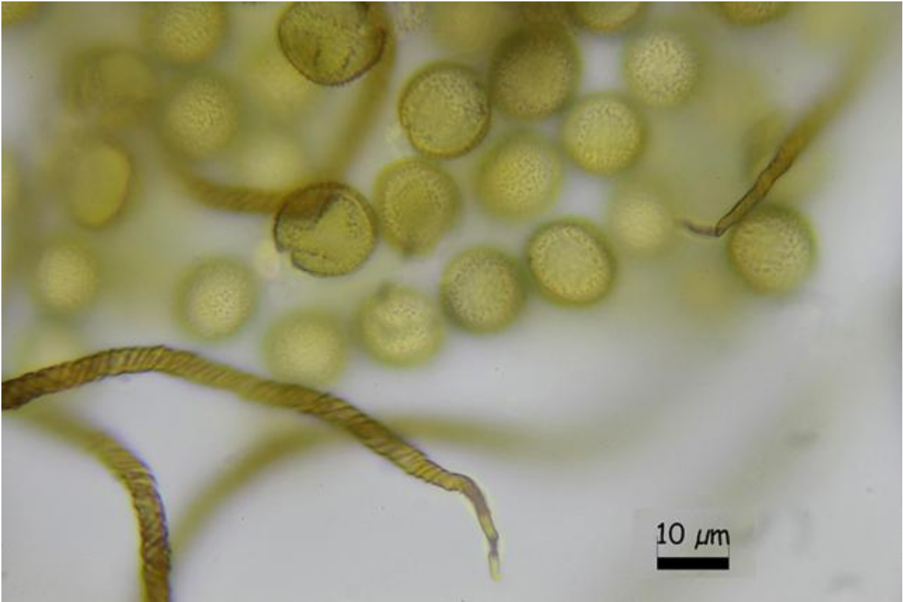
A. Esporas y capilicio agua 1000x.