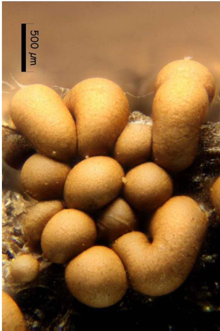
E. Esporocarpos 40x.