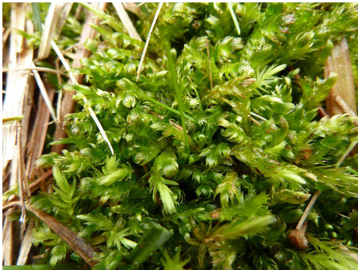
Porost Breidleria pratensis (PR Chvojnov).